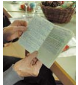
Chronik des Bastelkreises

Gefeiert wird das 25-jährige Bestehen nach dem Weihnachtsbasar am Montag, 30.11.2015, zu der die Gründerin und ihr Mann und alle Ehemaligen eingeladen werden. Günter Radde