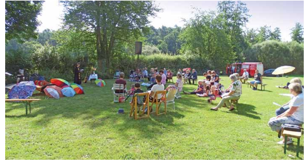
Open-Air in Neuses (Sonntag, 19. Juli)