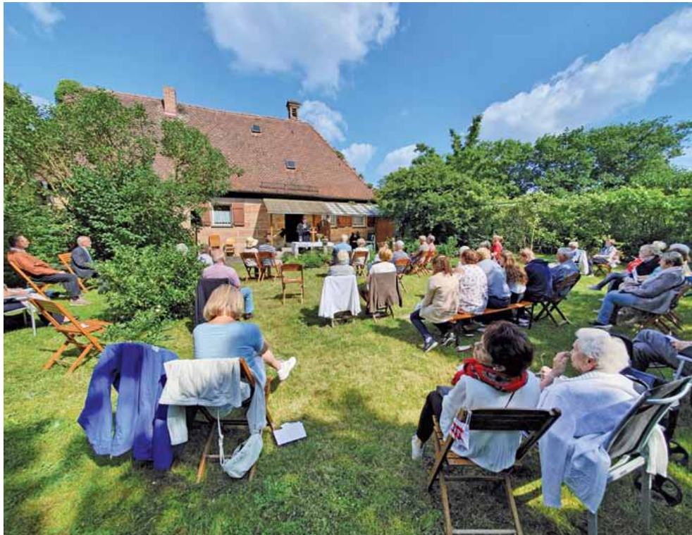
Open-Air im Mesnergarten (Sonntag, 21. Juni)

Die räumliche Begrenzung unserer Kirchen hat dazu geführt, dass wir viel bewusster Open-Air-Gottesdienst gefeiert haben.